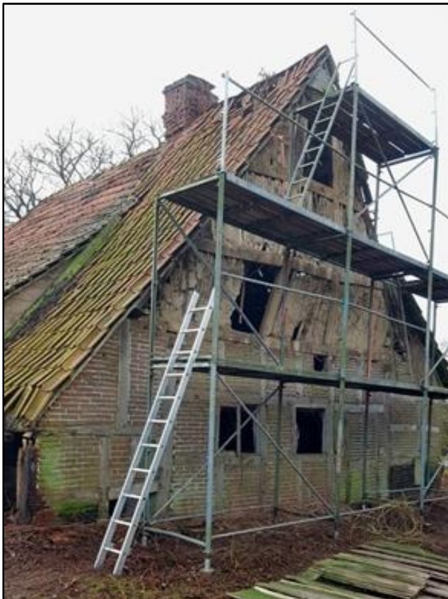
Abb. 4: Der freigelegte Fachwerk-Rückgiebel mit Spuren des früheren Fachwerkschornsteins

Aus der Struktur des Hauses und seiner topografischen Lage ergeben sich einige neuartige Aspekte. Beim ursprünglichen Bau, dem kammerfachlosen Flettdielenhaus von 5 Fach Länge (vgl. Abb. 1), kann es sich weder um ein ursprüngliches Heuerhaus (ungewöhnlich alt), noch eine alte Leibzucht (Altenteil, zu groß), noch um ein altes Vollbauernhaus (zu klein) handeln. Für weitere Erkenntnisse sind die historischen Verhältnisse und die topografische Lage im Dorf zu betrachten. Zu den historischen Wurzeln des Heuerlingswesens ist wenig bekannt. Die Bauzeit der Heuerhäuser im allgemeinen ist keinesfalls als sicheres Indiz anzusehen, da man – wie etliche Beispiele belegen – davon ausgehen muss, dass ältere Gebäude mit ursprünglich anderen Funktionen später zu Heuerhäusern umgenutzt wurden, wie z.B. auch das noch aus dem 15. Jh. stammende Heuerhaus des Hofes Wehlburg im Artland. Von Anfang an von eingessenen Bauern ausschließlich zum Zwecke der Vermietung