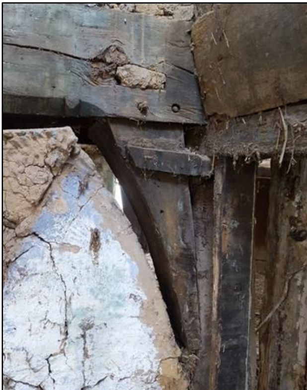
Abb. 2: Luchtbalken mit Knagge und Abfasung mit Fasenstopp, um 1600 (d).

Beim Vordergiebel hat es sich um einen Steckwalm gehandelt. Der Rückgiebel wurde als Fachwerkgiebel mit Lehmausfachung ohne Vorkragung ausgeführt (Abb. 4), jedoch zunächst mit nur einer Riegelkette und einem Kehlbalken. Wohl vor 1700 erfolgte ein Umbau mit Einbau eines in diesen integrierten Fachwerkschornsteines. Der Schornstein ist sehr früh, besonders wenn man beachtet, dass er im späten 18. Jh. wieder abgerissen und das Haus für etwas 100 Jahre wieder zum Rauchhaus wurde. Dabei blieb seine Rückwand als Bestandteil des Giebels erhalten